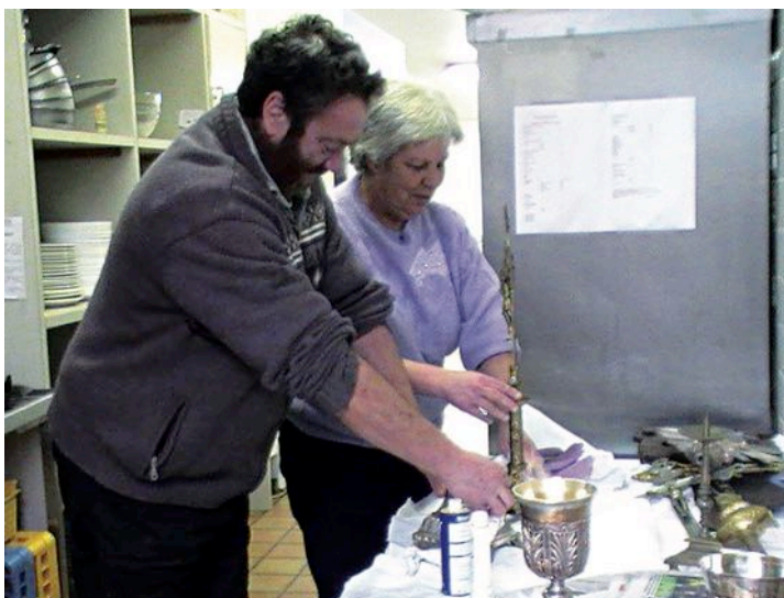
Nettoyage du Patrimoine de l'église après travaux Prieuré