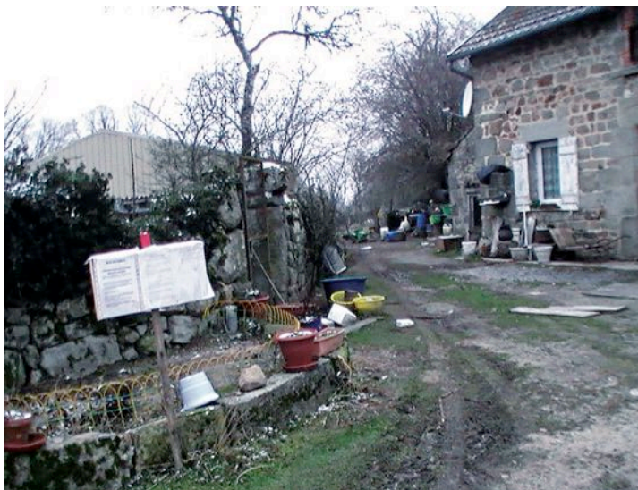
Chemin des roches