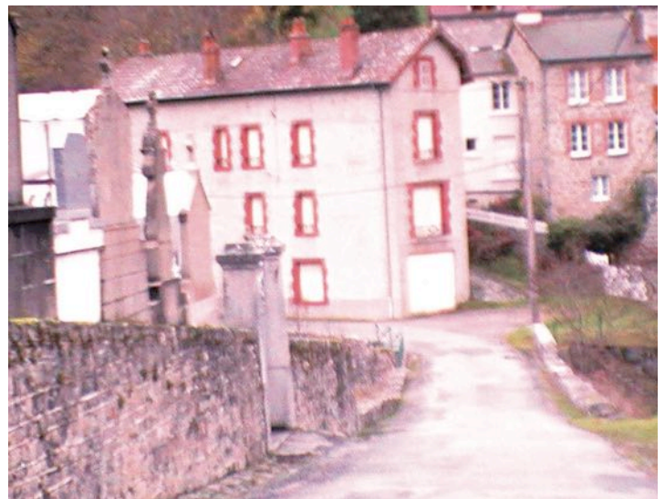
Maison du Bourg