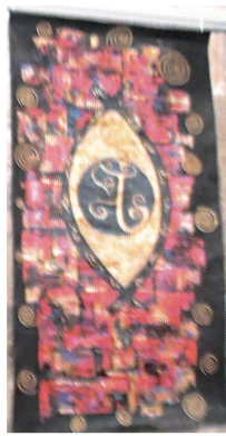
Expo église 2016