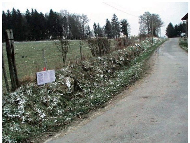
Voie communale Les Vergnes