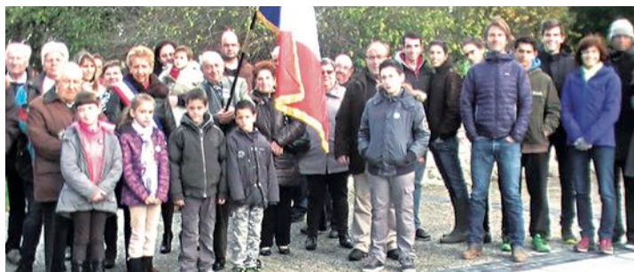
Commémoration 11 Novembre