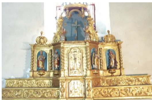
Retable classé de l'église