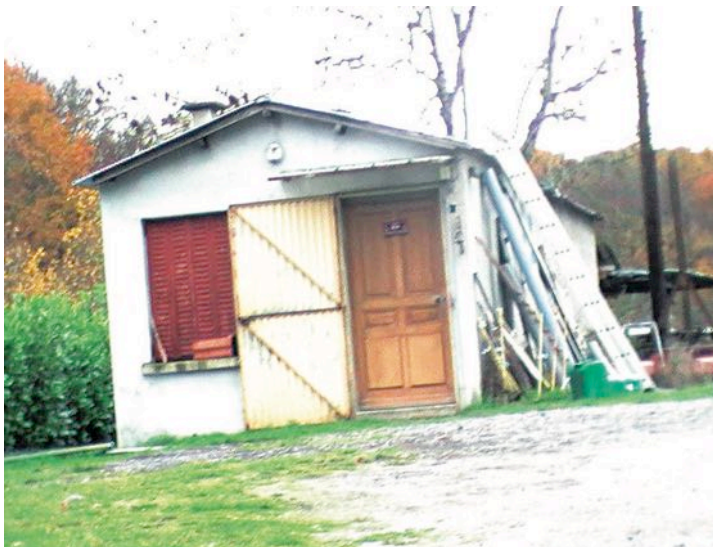
Bâtiment technique communal

La commune va réhabiliter et agrandir le local technique de l'agent d'entretien, réhabiliter la maison du bourg afin de la relouer ou de la vendre. La commune et les acheteurs vont terminer conjointement les travaux de déplacement d'une part d'un chemin communal aux Roches et d'autre part de la voie communale aux Vergnes, ceci pour des raisons de sécurité.