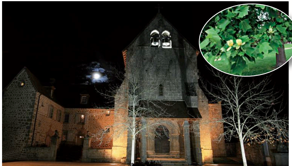
Le tulipier de Virginie, majestueux du printemps à l'automne qui a fleuri pour la première fois cette année, implanté sur la Place de l'Eglise.

Vous êtes tous chaleureusement invités à la cérémonie des vœux le dimanche 15 janvier 2017 à partir de 15h à la salle polyvalente.